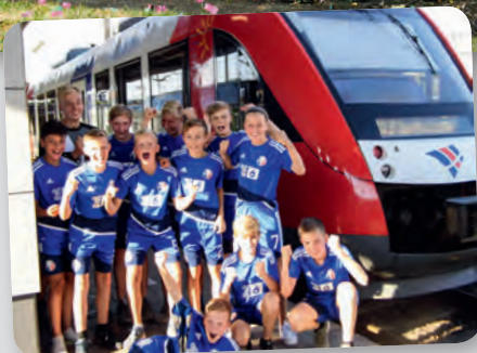
SV Tungendorf C-Jugend

Viel zum Jubeln gab es während der WM eigentlich nicht, aber das hielt unsere kleinen Kicker nicht davon ab, bei unserem Gewinnspiel „Jubelt wie die Weltmeister“ teilzunehmen. Für das beste Jubelfoto haben wir drei Jugendmannschaften aus dem Norden mit je 1.000 € Prämie belohnt.