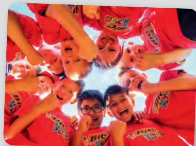
SV Wahlstedt E-Jugend

Die Vereine möchten die Prämien für Aufwärm-pullover, Trikots und die Teilnahme an einem Trainingscamp nutzen. Herzlichen Glückwunsch!