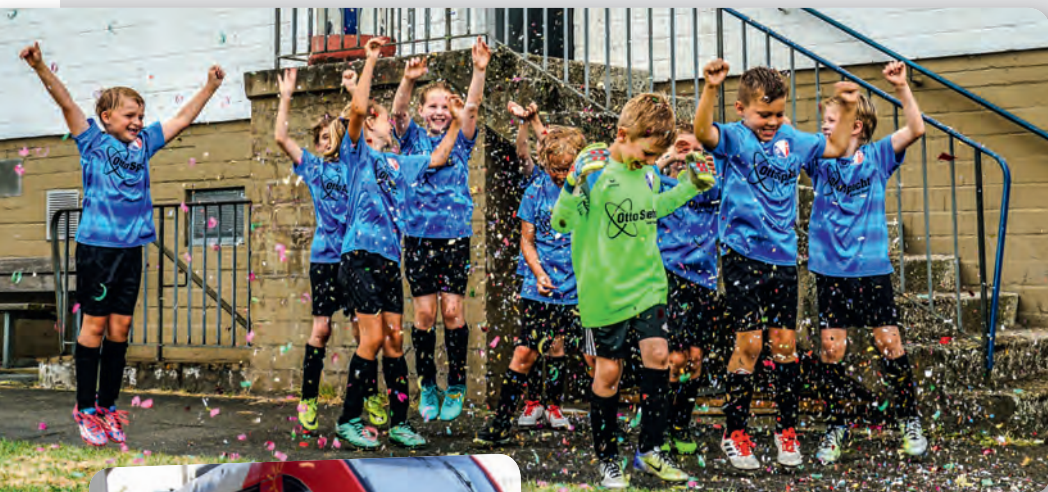
SVT Neumünster F-Jugend