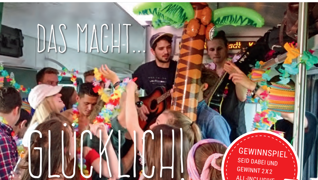
Beim Promo-Video Dreh an Bord der nordbahn sorgte die Hamburger Band Easy Shapes für gute Stimmung.

GEWINNSPIEL SEID DABEI UND GEWINNT 2 X 2 ALL-INCLUSIVE- TICKETS!