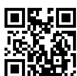
Ersatzhaltestelle Richtung Wrist

Von Gleis 2: Verlassen Sie den Bahnsteig in Richtung Bahnhofstraße. Biegen Sie nach rechts ab und folgen Sie dem Straßenverlauf bis zur jeweiligen Ersatzhaltestelle. Die Ersatzhaltestelle befindet sich an der Bushaltestelle Bahnhof Dauenhof.