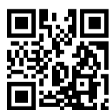
Ersatzhaltestelle Richtung Hamburg

Von Gleis 1: Verlassen Sie den Bahnsteig in Richtung Bahnhofstraße. Biegen Sie nach links ab und folgen Sie dem Straßenverlauf bis zur jeweiligen Ersatzhaltestelle. Die Ersatzhaltestelle befindet sich an der Bushaltestelle Bahnhof Dauenhof.