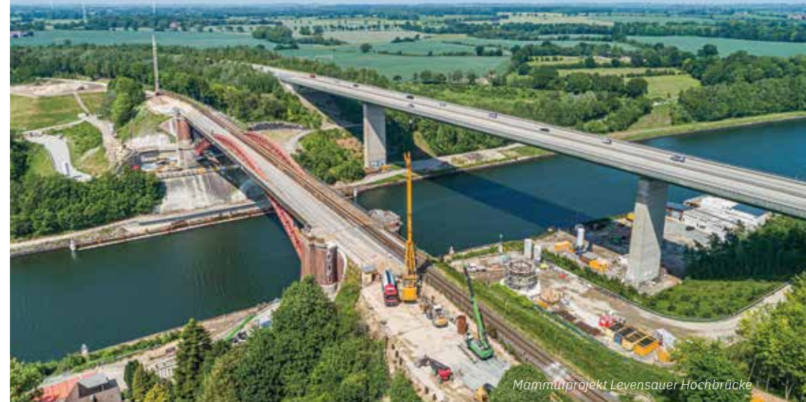
Mammutprojekt Levensauer Hochbrücke

der Bahn. Nach dem Ausbau der alten Brücke stellte sich jedoch heraus, dass dieses Verfahren nicht funktioniert und die Arbeiten von den Gleisen aus erfolgen mussten. Zudem wurden die Bauleute durch Hindernisse im Baugrund aufgehalten. Erst nach Abschluss dieser Maßnahme kann der Überbau eingehoben und Gleise und Kabelkanäle wiederhergestellt werden.