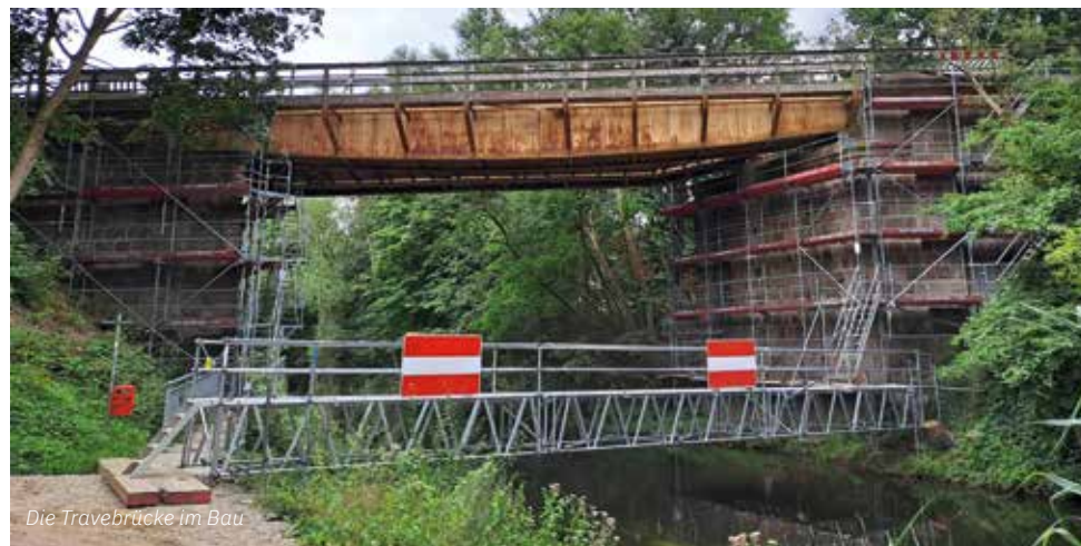
Die Travebrücke im Bau

Eisenbahnbrücken können weit über 100 Jahre alt werden. Sie werden regelmäßig überprüft, gewartet und bei Bedarf saniert. Hat eine Brücke ihre technische Lebenszeit erreicht, wird sie ersetzt. Etwa 1.000 Eisenbahnbrücken in Deutschland befinden sich derzeit im „Seniorenalter“ und müssen in den nächsten Jahren erneuert werden. Das klingt viel, entspricht aber nur vier Prozent aller deutschen Eisenbahnbrücken. Außerdem sind sie in diesem Stadium noch bis zu 15 Jahre